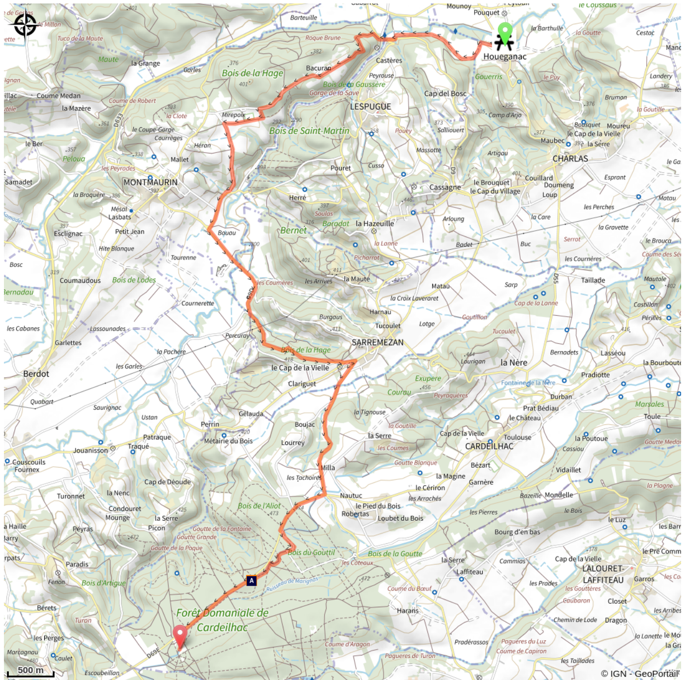
🐾 La Rainette méridionale (A)