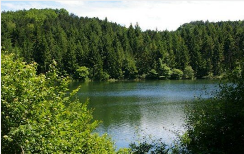
(CC Coeur & Coteaux Comminges)