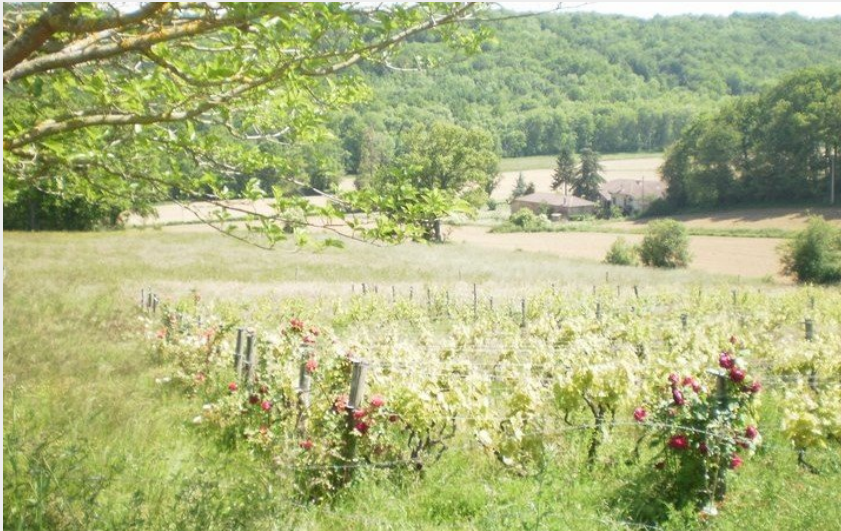
(mairie Cazaril Tambourès)