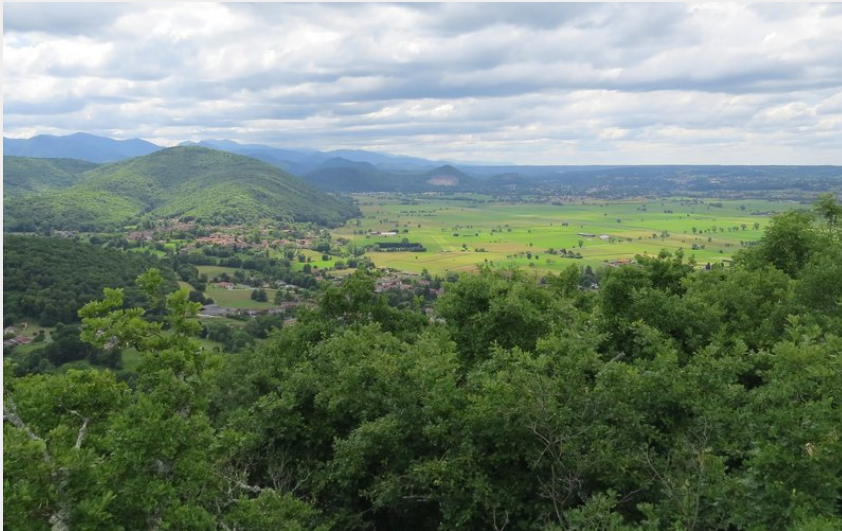
(CC Cœur & Coteaux Comminges)