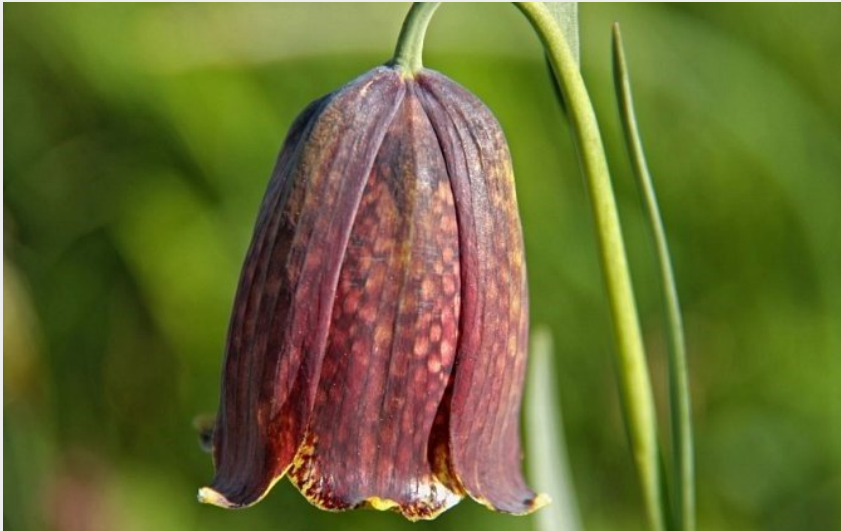
(CC Coeur & Coteaux Comminges)