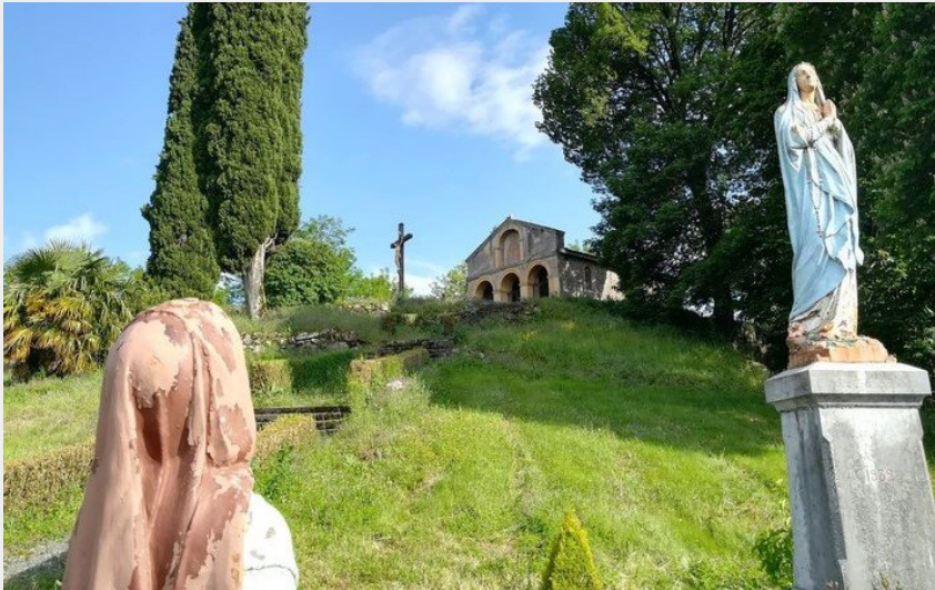
(CC Coeur & Coteaux Comminges)