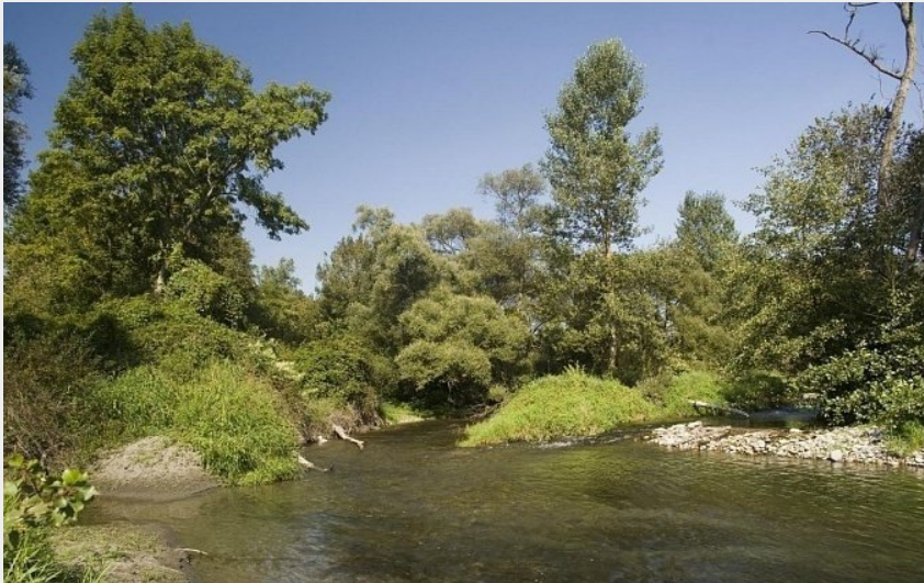
(CC Coeur & Coteaux Comminges)