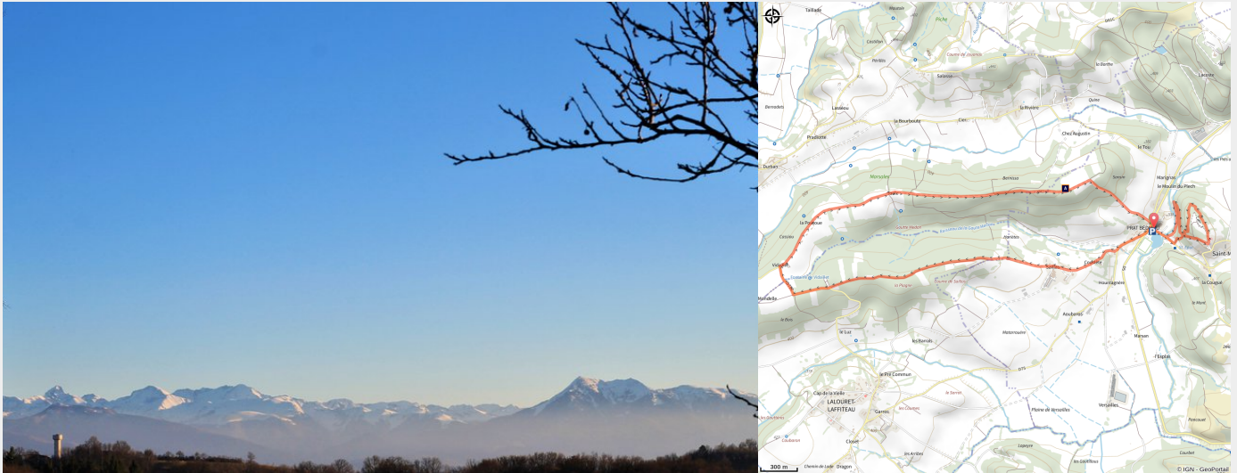
Vue sur la chaîne des Pyrénées