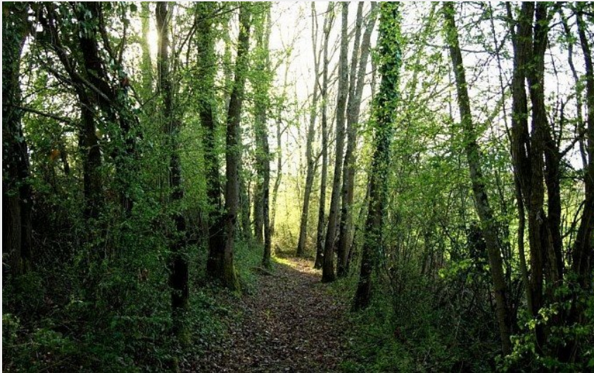
(CC Coeur & Coteaux Comminges)