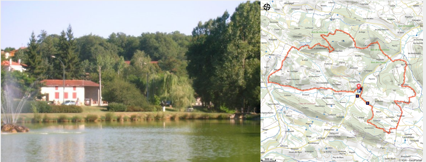
(CC Cœur & Coteaux Comminges)