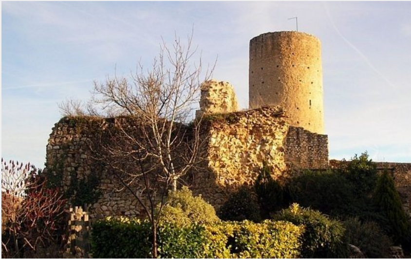
(CC Coeur & Coteaux Comminges)