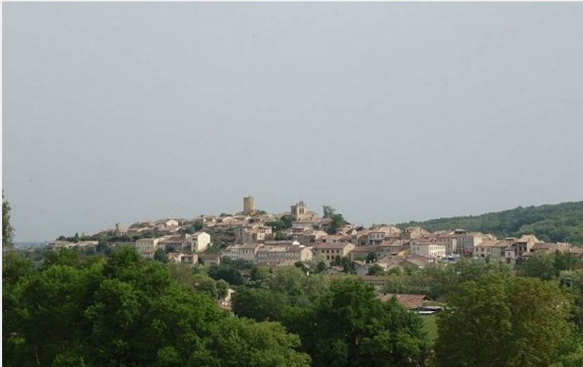
(CC Cœur & Coteaux Comminges)