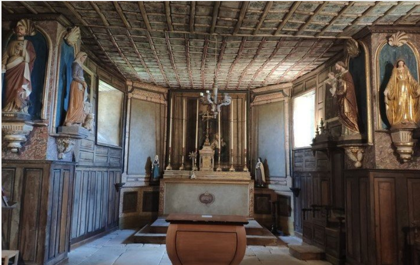
(CC Cœur & Coteaux Comminges)