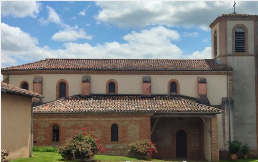
(CC Cœur & Coteaux Comminges)