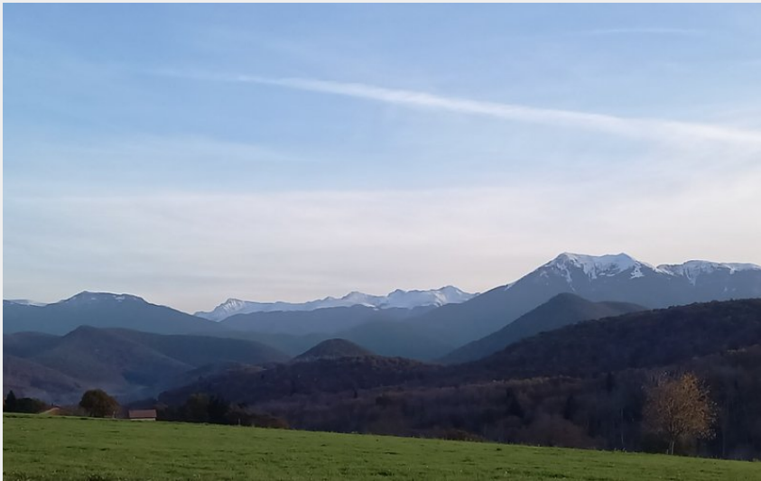
Vu sur les Pyrénées