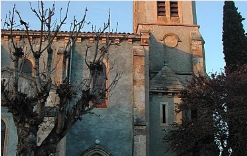
(CC Coeur & Coteaux Comminges)