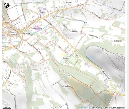
City stade 1-Aurignac

La Mairie et le Conseil Municipal des Jeunes vous propose un terrain multi-sport en accès libre, aux portes d'Aurignac, accessible par le chemin de mobilité douce de la Fontaine Vieille.