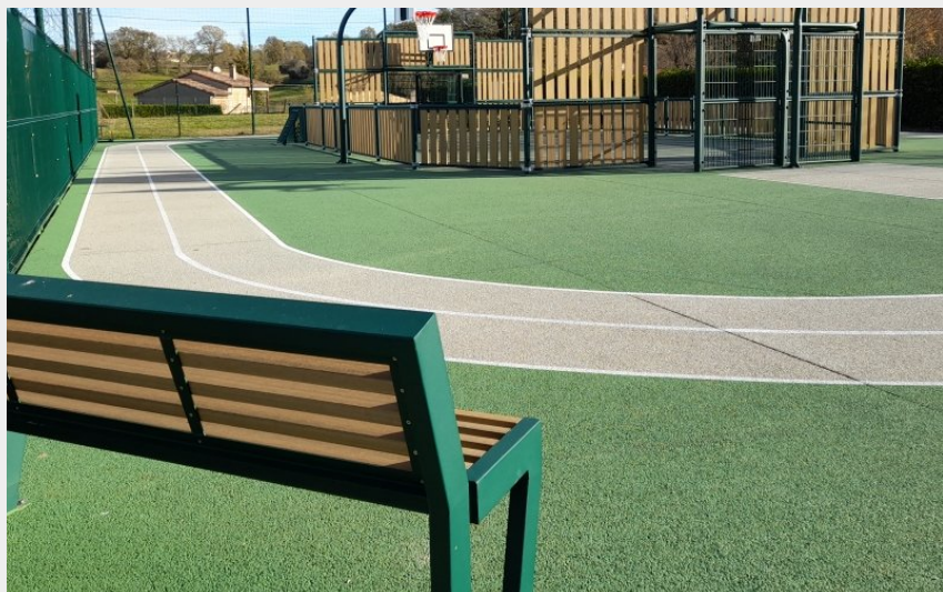
City stade 1-Aurignac